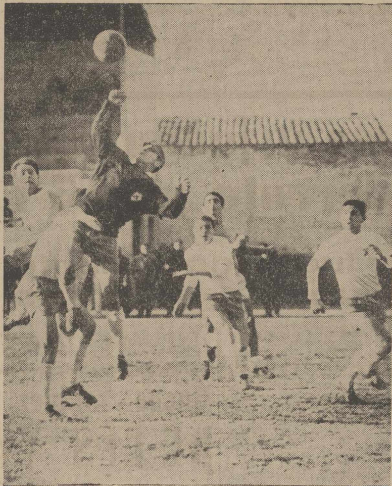
El portero leonés despeja un balón sin demasiado peligro, ya que en su zona no había ningún atacante morado.

Pero no hay más remedio que atacar a las teclas que me están invitando a hacerlo ante mi vista un tanto triston. ¿Que a qué viene este preámbulo? Los escasos espectadores que en este domingo estuvieron en La Balastera lo comprenderían sin