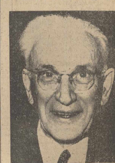
El presidente de la Cámara de Representantes John W. McCormack, que tras el asesinato del presidente Kennedy ocupa hoy el primer lugar en la línea de sucesión a la Presidencia de los Estados Unidos