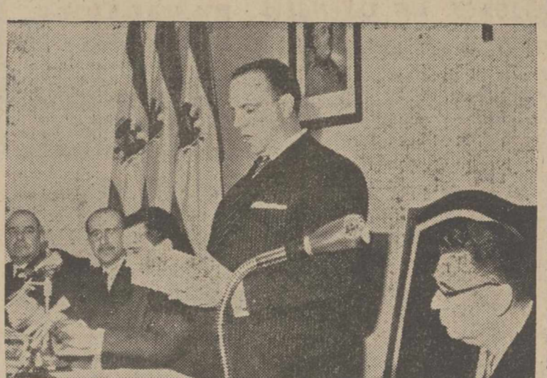
Madrid.—En el aula magna de la Escuela Oficial de Periodismo y presidido por el Ministro de Información y Turismo, Sr. Fraga Iribarne, se ha celebrado la solemne sesión de apertura del curso. Haciendo entrega de los títulos a los nuevos periodistas de honor. En la foto, una vista de la presidencia.