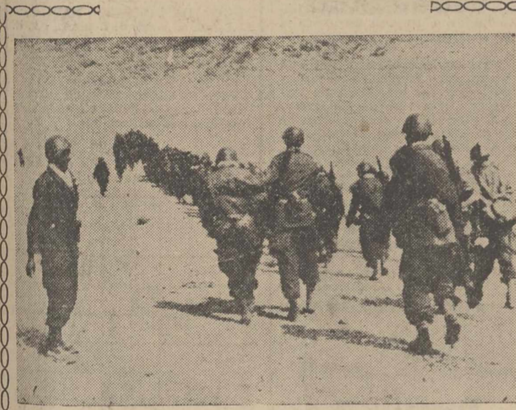
Figui (Marruecos).—Una columna del Ejército real marroquí se dirige hacia la ciudad de Figui, centro de los más violentos combates contra los argelinos. Aunque parece que éstos ya han cesado.

BASE: La última agresión argelina contra Figui, incumpliendo el alto el fuego