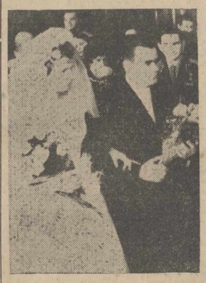
MOSCÚ.—Adrián Nikolav, cosmonauta ruso número tres, ha contraído matrimonio con Valentina Tereshkova, cosmonauta número seis, en el palacio de los matrimonios de la capital soviética. En la foto, los contrayentes, durante la ceremonia. En último plano, a la derecha, Valery Bikovsky, en uniforme, otro de los cosmonautas testigos del matrimonio.