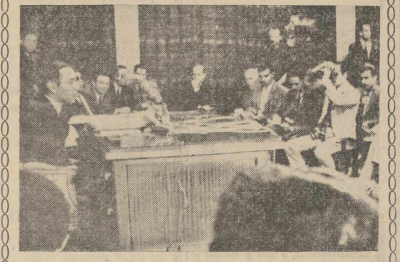
Marrakech. — En una conferencia de prensa celebrada en Marrakech, el Rey Hassan dio cuenta de una carta del presidente Nasser...

Aún quedan muchos "cabos sueltos" que pudieran malograr la proyectada conferencia