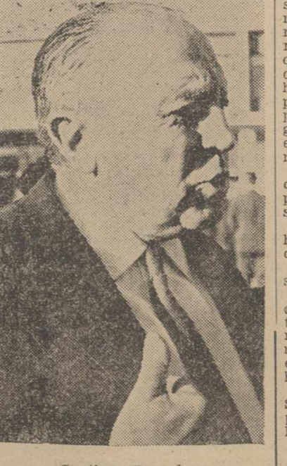
Santiago Bernabeu