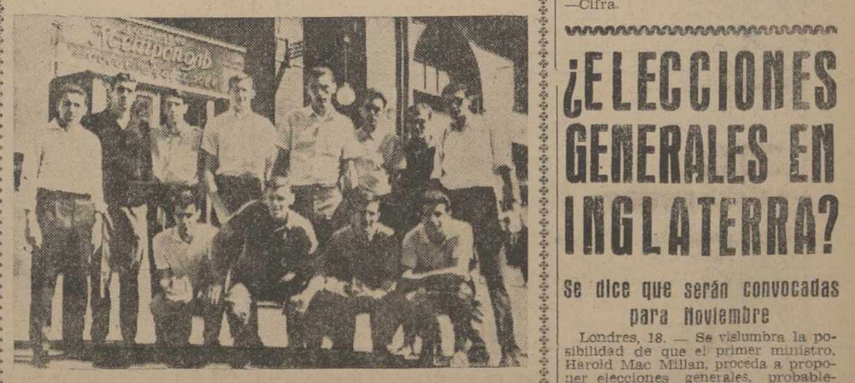
Después de su equipo de fútbol, el de baloncesto ha dado al Real Madrid fama internacional y dimensión ampliamente deportiva. Ahora, después de conquistar el subcampeonato de Europa, brillantemente, ante los campeones soviéticos, la Junta General futbolística del Club ha decidido suprimir su sección de baloncesto dentro del plan previsto, para economizar este año 21 millones de pesetas. En la foto vemos a los integrantes del equipo madridista ante el Hotel Metropol de Moscú, con ocasión de su última intervención internacional.