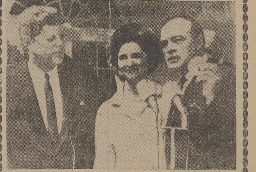
Washington.—Por sus relevantes servicios a la causa de la paz, el Presidente Kennedy ha condecorado con la Medalla de Oro al actor Bob Hope, que en unión de su esposa aparece junto al Presidente en la puerta de la Casa Blanca. Bob Hope muestra la medalla que le fué entregada por el Presidente americano.