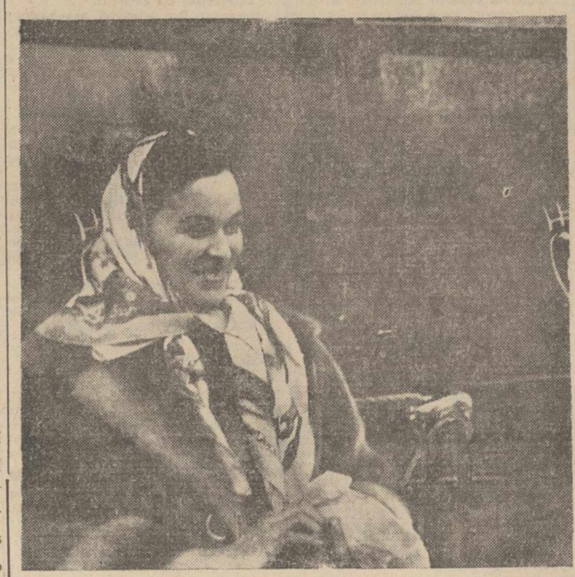
Lucía Bosé.

CAMINO DE SIERRA MORENA. Son las dos de la tarde. Lucía demuestra su impaciencia por llegar a la comida de sus hijos. —Con mi coche estoy en Pozuelo en menos de media hora. Miguel y los niños me esperan. —Siempre comen juntos? —Siempre. Hablamos de la comida de lo que a Luis Miguel le gusta más: —Le encanta que me meta en la cocina y prepare los spaghetti y el arroz a la milanés, que son mis dos especialidades. —No. Lo demás es una afición que los dos tenemos en común y de la que participamos con frecuencia. —¿Cuál es? —La cacería. Esta tarde concretamente salimos de caza camino de Sierra Morena... Lucía se ha pasado toda la mañana de compras por la ciudad. —Zapatos, jerseys, calcetines, los niños necesitaban de todo. —Vuelva a mirar al reloj. Nos levantan. Segundos después el ruido del motor de su coche se pierde por la Castellana.