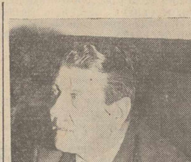
Otto Skorzeny.

«No es mi pueblo quien pide mi extradición para juzgarme como criminal de guerra», tampoco al Gobierno. Es un hombre, un político, un comunista: el ministro de Justicia de Austria, Dr. Brieda. Así, con la misma valentía que en 1943 le convirtió en un héroe mundial, Otto Skorzeny responde a la noticia procedente de Viena y en la que se dice que las autoridades austriacas investigan actualmente si existe alguna posibilidad de pedir la extradición del hombre que rescató a Mussolini durante la pasada guerra mundial. «Todas las fuerzas de la Policía austriaca tienen orden de detener a Skorzeny si entra en Austria».