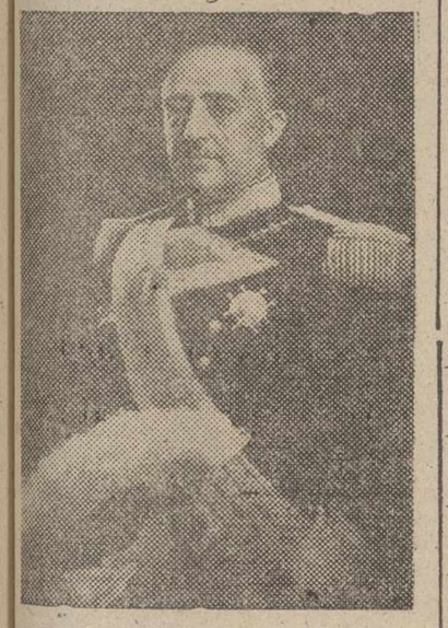
S. E. EL JEFE DEL ESTADO Roma.—Bajo el título de «El regreso a España», el Observador Romano publica en su primera plana la noticia de que, siguiendo una antigua tradición de los Reyes de España, el Jefe del Estado español ofrecerá a Su Santidad un artístico martillo destinado a la apertura de la Puerta Santa de la basílica de Santa María la Mayor, acto con el cual el pueblo de España quiere manifestar la inquebrantable devoción que, le liga al Pontífice y a la Santa Sede.

Franco ofrecerá a S. S. el Papa un artístico martillo para la apertura de la Puerta Santa De este modo, España manifestará, una vez más, la devoción que le une al Sumo Pontífice y a la Santa Sede