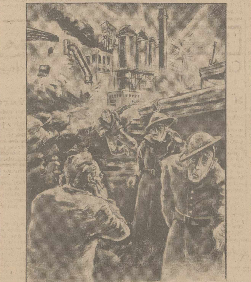
La aviación alemana, bombardeando un importante centro industrial inglés. (Dibujo de un corresponsal de guerra alemán)

Han machacado con bombas explosivas e incendiarias una ciudad del Oeste