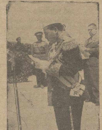
S. A. I. el Jalifa leyendo el discurso, transmitido por radio, en el homenaje al Caudillo Franco, al celebrarse el IV aniversario del Alzamiento.