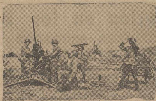
Defensas antiáreas en pleno funcionamiento

Montevideo, 3.—El Senado uruguayo ha aprobado un proyecto de ley sobre la implantación del servicio militar obligatorio en el país.—Efe.