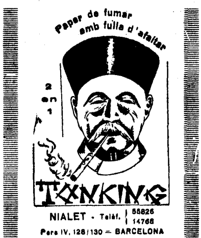
NIALET - Tel. 14768 Para IV. 128/130 - BARCELONA

La Junta agrairà que al dit acte hi concorrin el major nombre possible d'afiliats i amics per tal de donar-hi el major relleu.