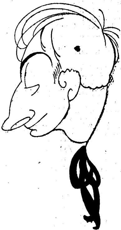
AUTO-CARICATURA DE «SHUM»