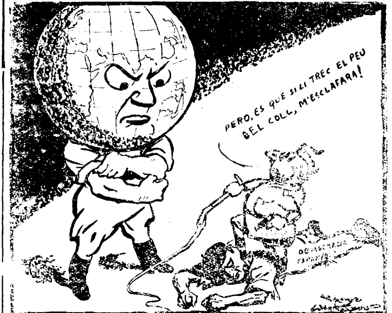
El dilema del Dictador (Del DAILY HERALD, 26-9-45)

i ara tenim companys que no tindriem si els interessos de partit, l'amor propi i els prejudicis inicials haguessin pogut obrar damunt d'ells, com en els temps pretèrits. Ara que tots hem anat quedant nus, ens coneixem millor, i àdhuc podem fer el cens dels que no vindran, com en una sessió de seminar, feiem el cens dels tipus d' homo economicus , dels reeixits, dels que han triomfat en el camp i de la faiso que nosaltres no volem triomfar, perquè som gent d'una altra llei i soldats del nostre sou.