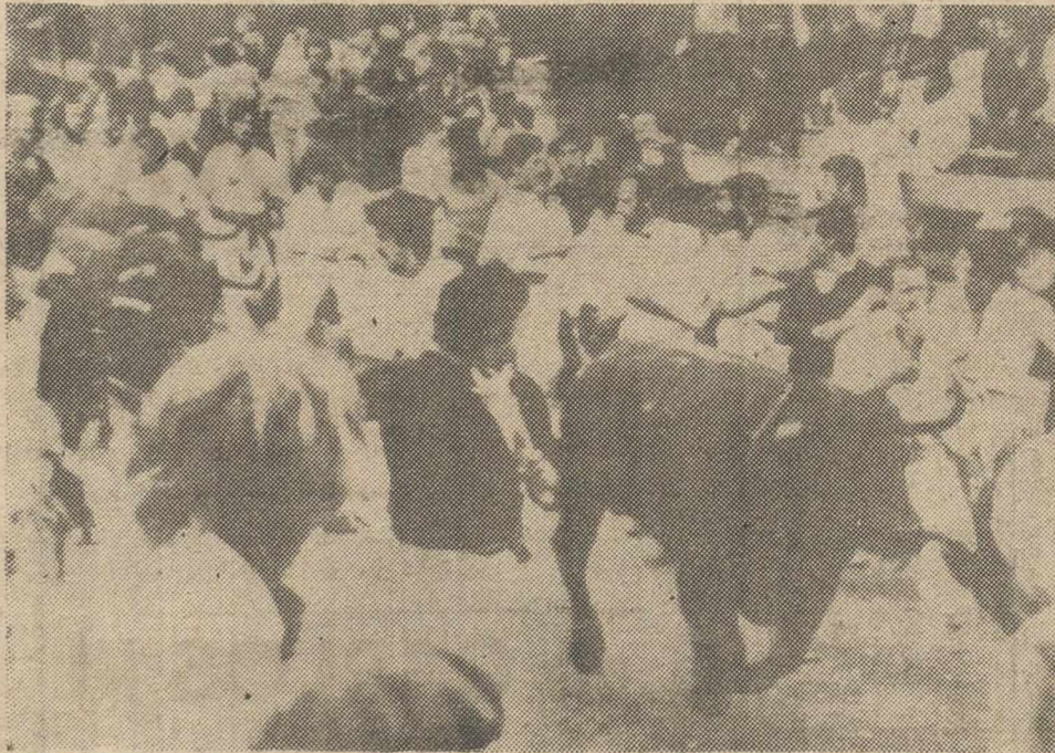
PAMPLONA.— Se celebró esta mañana el primer encierro de las Fiestas de San Fermín, sin ningún accidente importante, aunque abundaron los sustos y los revolcones entre los corredores. La fotografía corresponde al paso de los toros y muchachos por la calle de la Central de Teléfonos.

PAMPLONA, 7 (Efe). — Ninguna novedad se ha registrado en el primer encierro de las fiestas de San Fermín, desarrollado esta mañana.