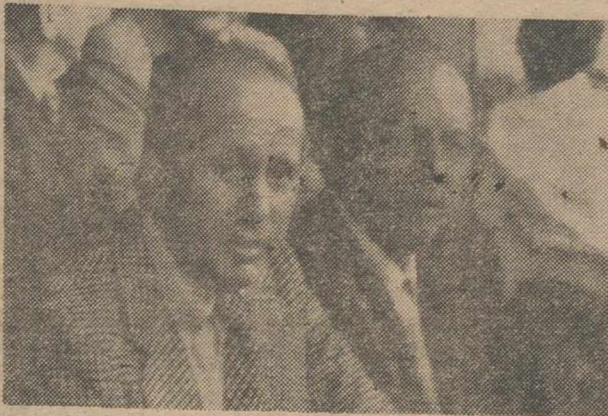
Un ex-jugador del Albacete Balompié, presencia n.º 10 del partido del domingo en el mundillo nacional.

Le preguntamos en el descanso, aún con cero-cero en el marcador.