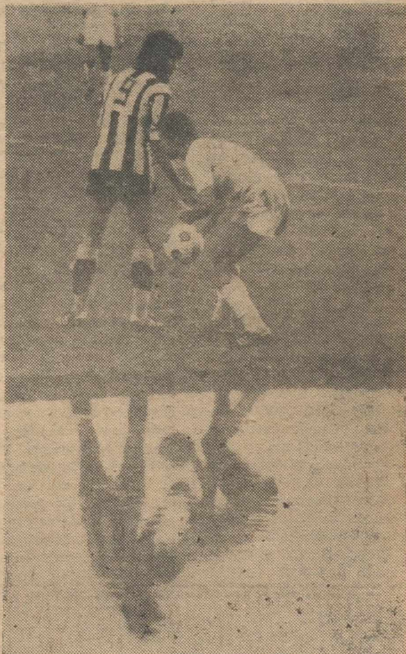
En este bello juego de imágenes se recreó nuestro fotógrafo, que fue, posiblemente el que más se divirtió en el último partido oficial de la temporada, del que ofrecemos amplia información en páginas interiores.— (Foto Jesús MORENO).