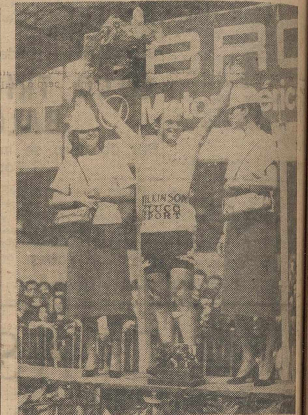
SAN SEBASTIAN.— En la fotografía, Hinault, en el podio, tras proclamarse vencedor de la prueba.