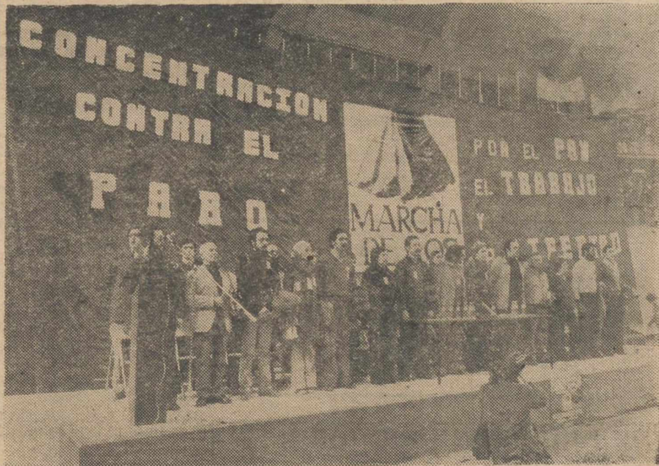
MADRID. — A primeras horas de la tarde del domingo, tuvo lugar la marcha de los parados, con una concentración en el Palacio de los Deportes, en la que estuvieron presentes parados de todo el país, así como algunas figuras de la vida política nacional. En la foto, los miembros de la coordinadora de la marcha.

(Amplia información deportiva en páginas interiores)