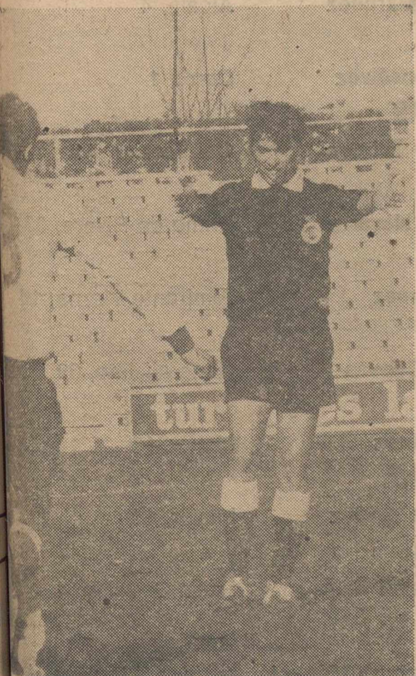
Hubo en el encuentro At. Albacete-Torrevieja brillante alguna. Ni tan siquiera lucha como aparenta la foto superior: todo fue gris, monótono, hasta el extremo de que el árbitro, como parece en la foto, tuvo que alertar a los jugadores.