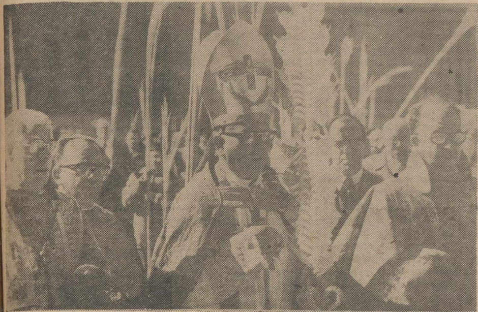
Pese al ostensible descenso de temperatura, la ciudad tuvo una gran animación en el Domingo de Ramos, fecha inicial de la Semana Santa. Muchos

fieles asistieron a los cultos de todas las parroquias, y de forma especial en la Santa Iglesia Catedral, donde el obispo de la Diócesis ofició la misa, presidiendo la procesión de las palmas, celebrada finalmente, en los aledaños del templo, a la que asistieron primeras autoridades y representaciones.