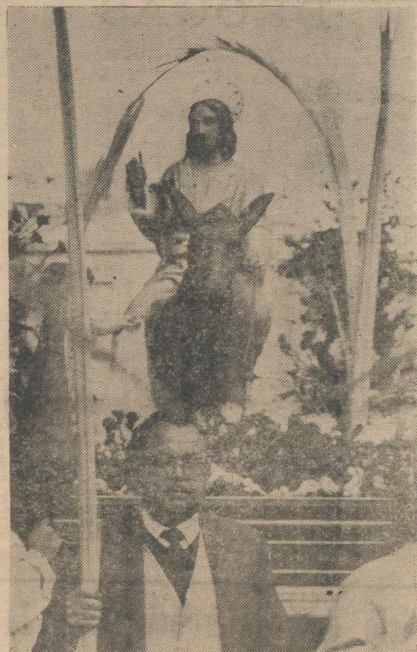
La Semana Santa albacetense se inició con la procesión de "Las Paimas" y la de la "Entrada de Jesús en Jerusalén", a la que corresponde este "paso". (En página tercera, más información).

El marco alemán ha pasado de 2,293 a 2,245 francos (-2 por ciento). El franco suizo bajó de 2,487 a 2,395 (-3,5 por ciento). El dólar descendió a 4,60 francos (-1,5 por ciento).