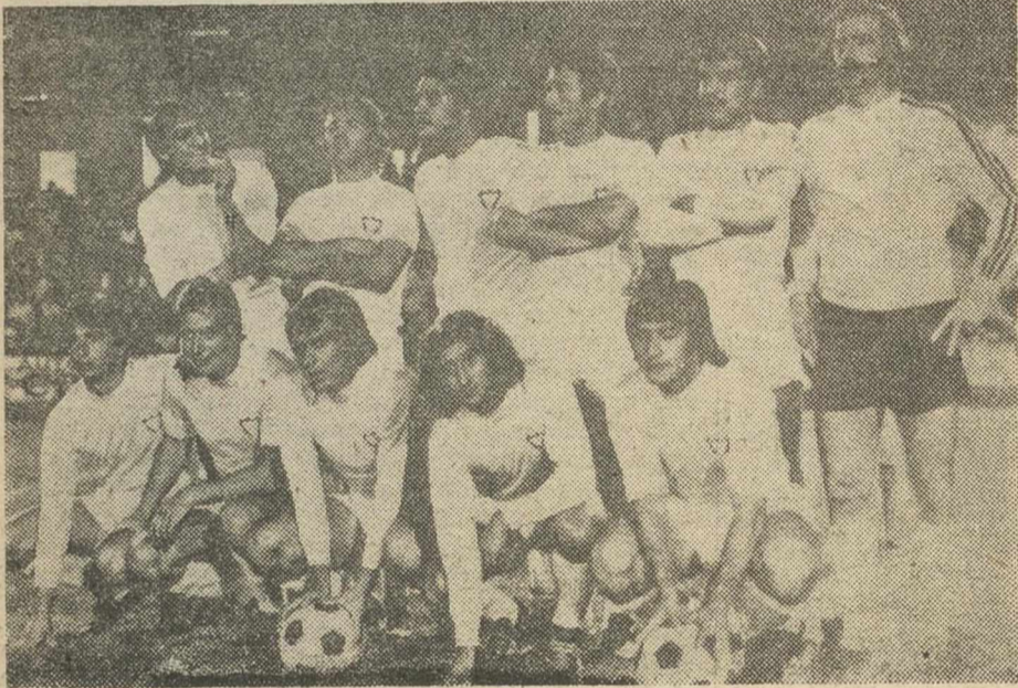
ALBACETE BALOMPIE

El equipo albacetense gran favorito para el título de campeón Ortega, autor de los cuatro goles