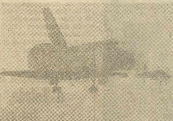
BASE EDWARDS (California). — La astronave americana realizó el viernes su primer vuelo libre, evadiéndose por encima del "Jumbo-747" que la transportaba.