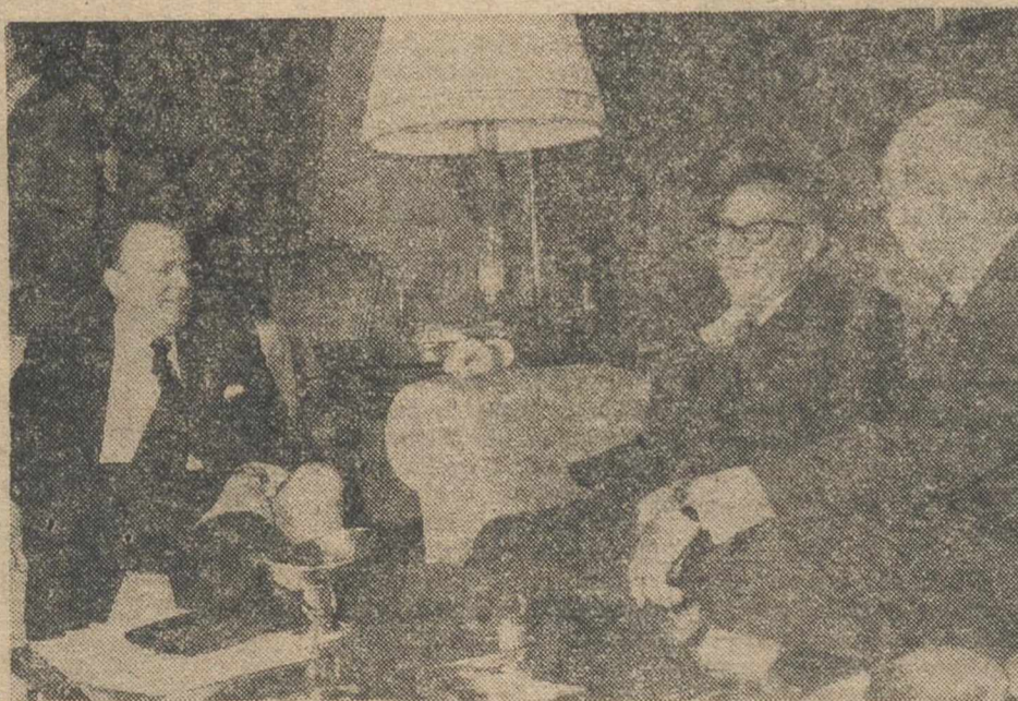
MADRID.—El ministro de Asuntos Exteriores, señor Areilza, ofreció un almuerzo de trabajo al secretario de Estado norteamericano, Henry Kissinger y al que asistió el ministro de la Gobernación, señor Fraga Iribarne. El almuerzo tuvo lugar en el Palacio de Viana.