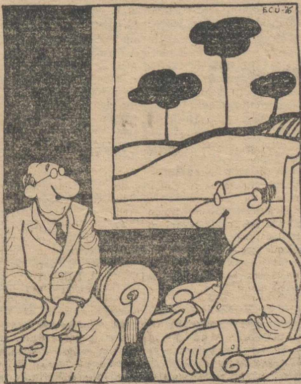
Después de todo, yo también soy partidario del Gobierno. ¡Pero de antes de la guerra!