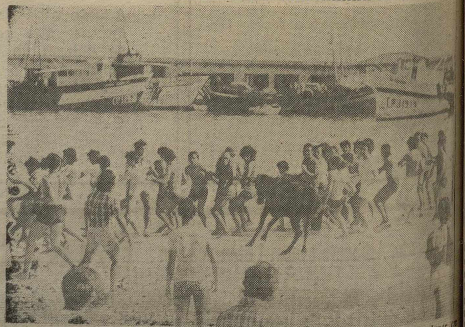
BENICARLO (Castellón). —Un momento del encierro que ha tenido lugar en esta localidad, con motivo de sus fiestas patronales. Las vaquillas son corridas en la playa, junto al mar, yendo a parar muchas al agua, dándose un remojón.