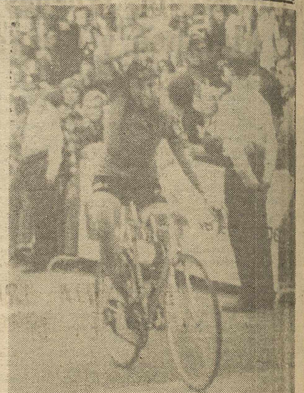
YVOIR (Bélgica).—El holandés, Hendrikus Kuipers, cruza vencedor la línea de meta de la prueba de fondo en carretera, de los Campeonatos del Mundo de Ciclismo.