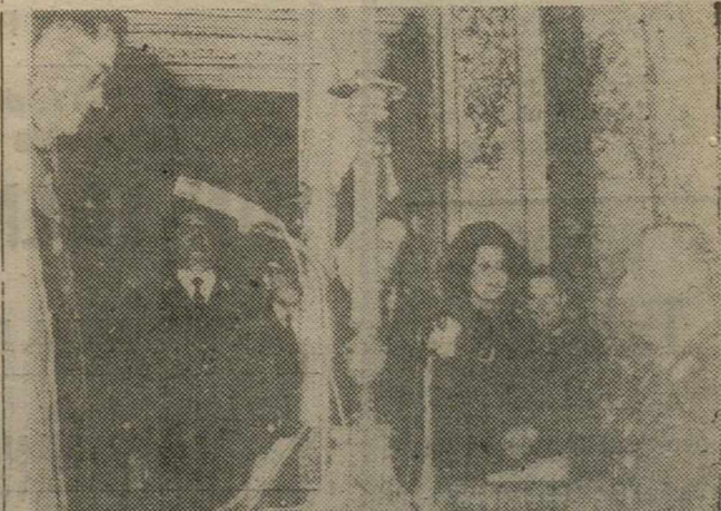
LIMA.—El general Francisco Morales Bermúdez, en el momento de prestar juramento, como nuevo presidente de Perú.