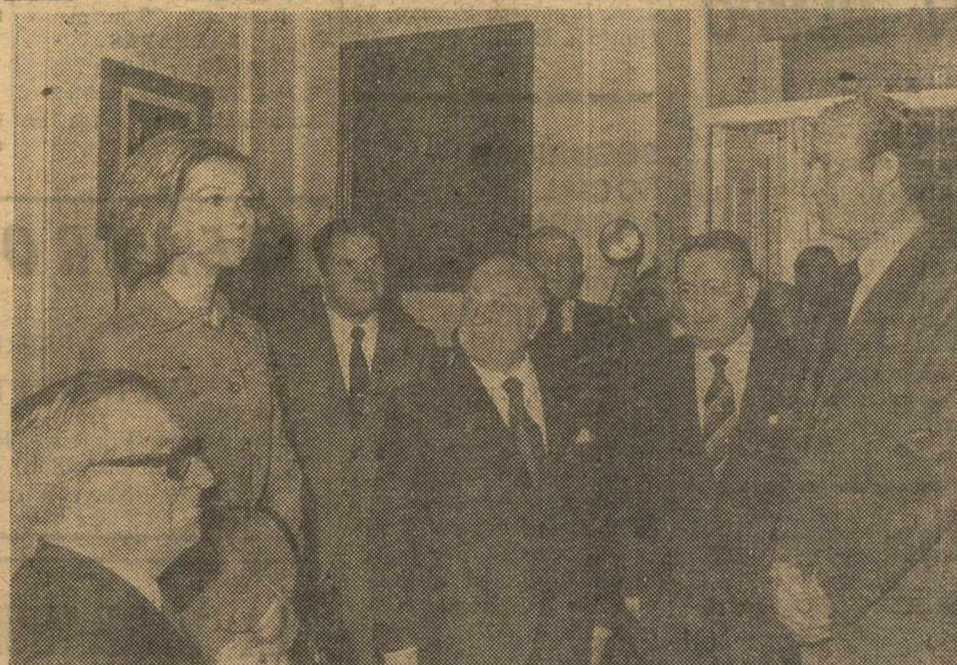
MADRID.—SS. AA. RR., los Príncipes Don Juan Carlos y Doña Sofía, durante la visita que han realizado a la Sociedad General de Autores, en donde fueron recibidos por el presidente de la misma, maestro Moreno Torroba. Durante el acto, el Príncipe recibió un pergamino con el nombramiento de Presidente de Honor de la citada Sociedad.