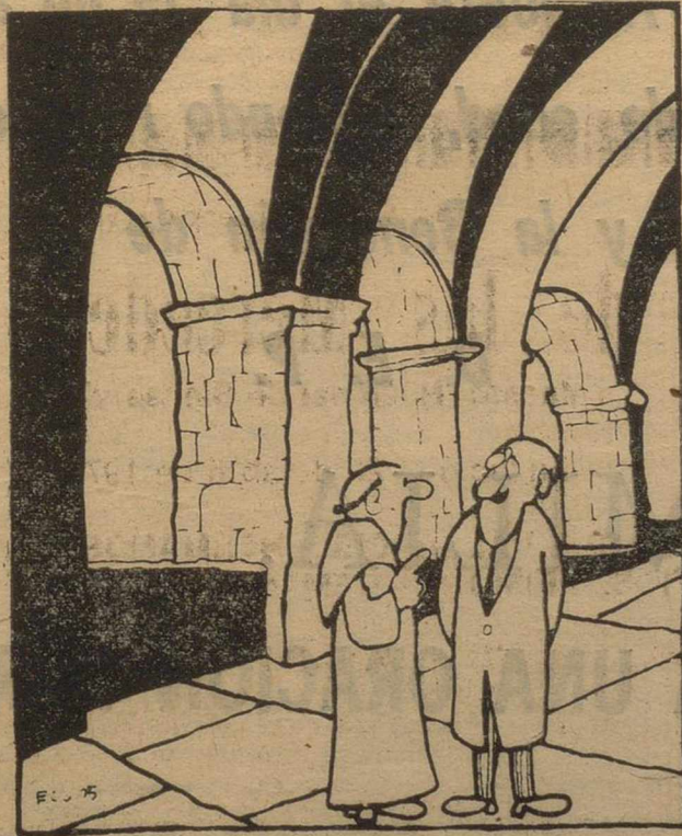
Aquí, lo que hace falta es menos progreso industrial, y más novenas...