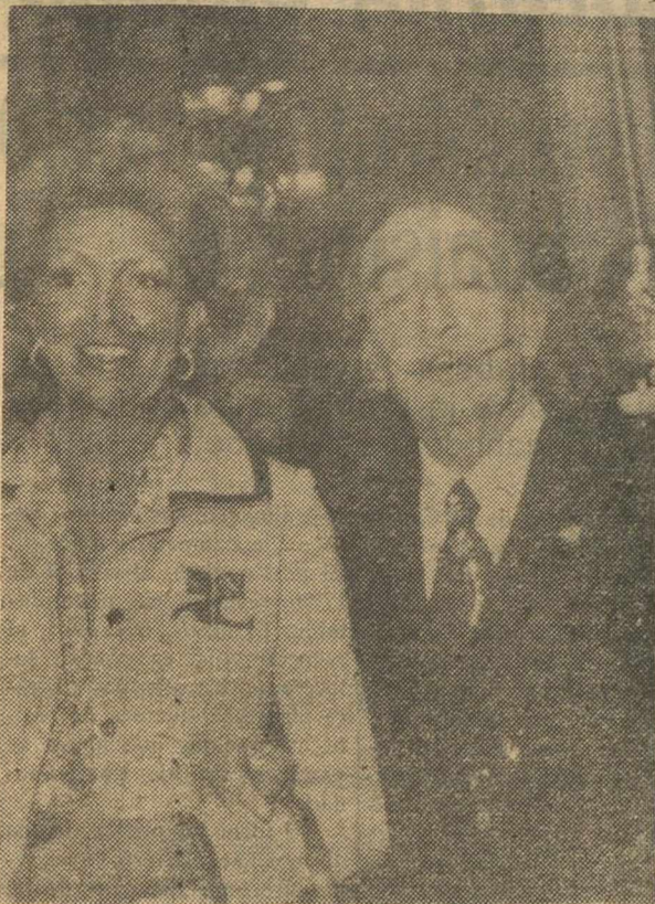
PARIS.—El pintor Salvador Dalí, saliendo de la Galería Diana, acompañado de una bella señora que no fue identificada por el fotógrafo, después de inaugurar una exposición de sus dibujos.