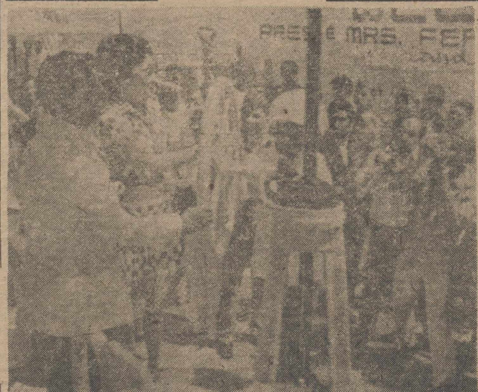
MANILA.—El presidente de Filipinas, Ferdinand E. Marcos y su esposa Imelda, accionan el volante que inaugura el primer envío de petróleo crudo de la República Popular China, a una refinería de Filipinas.