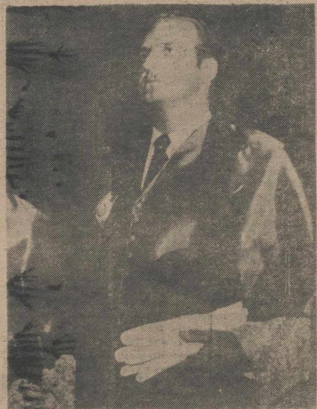
BILBAO.—El Príncipe de España, acompañado de su esposa, la Princesa doña Sofía, ha presidido en esta capital los actos conmemorativos del 75 aniversario de la creación de la Escuela de Ingenieros Industriales, en el transcurso de los cuales el Príncipe fue investido como Doctor Honoris Causa.—(Telefoto CI-FRA GRAFICA).