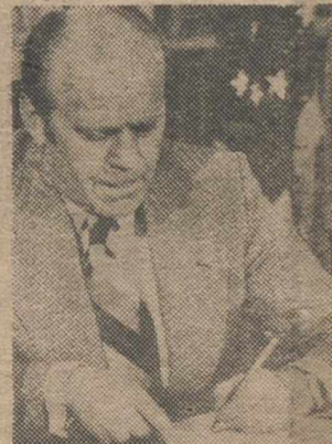
Henri Ford firma el veto a un proyecto de Ley por el que se requería el corte de la ayuda militar a Turquía.