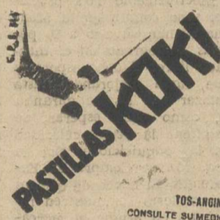
TOS-ANGINA! CONSULTE SU MEDICO

con servicios establecidos hace más de veinte años, con las principales plazas del Norte de España y Madrid, necesita persona activa y bien relacionada para hacerse cargo de la representación de esta Empresa en la plaza de Albacete. Amplias referencias y solvencia económica. Dirigirse a Bilbao, Casa Central, Apartado 1.012.