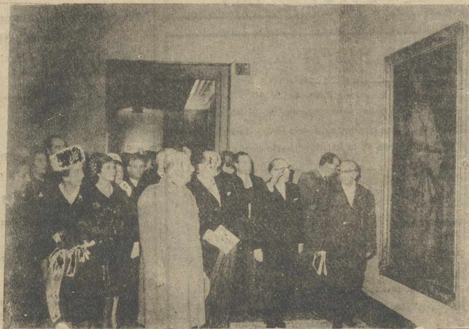
El Jefe del Estado ha inaugurado la Exposición del III Centenario de la muerte del pintor Francisco Zurbarán, en el Casón del Buen Retiro de Madrid. En la foto vemos al Caudillo, acompañado de su esposa, del ministro de Educación Nacional y del director general de Bellas Artes, durante la inauguración.