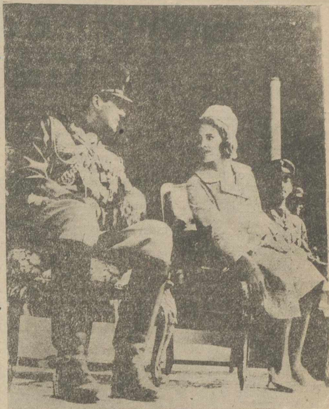
El rey Constantino aprovecha toda ocasión—como vemos en la foto—para informar a su esposa sobre cuanto aún desconoce de su nuevo reino, con motivo de una ceremonia oficial presidida por la joven pareja. (FOTO FIEL).