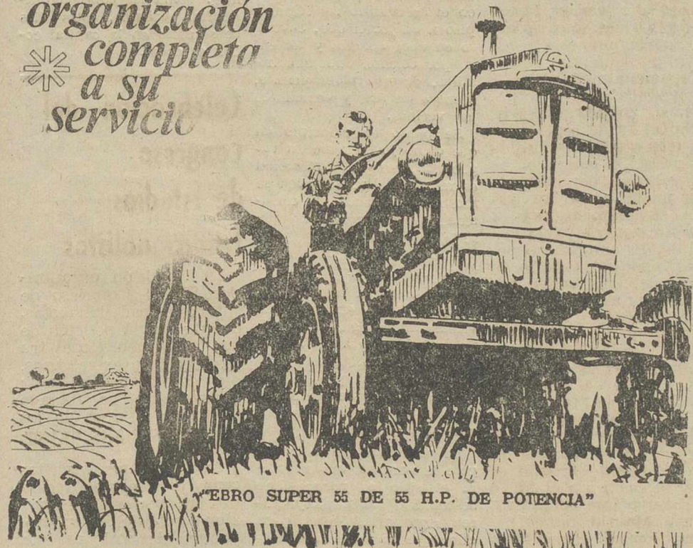
"EBRO SUPER 55 DE 55 H.P. DE POTENCIA"