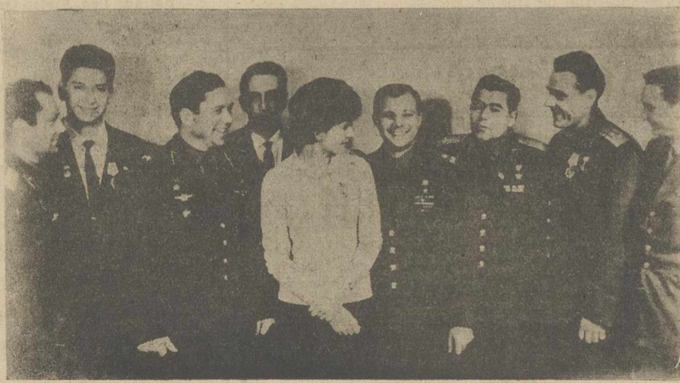
La tripulación del Voskhod, posa con los demás cosmonautas, que la antecedieron en la ruta del cosmos, a su regreso a la "Ciudad de las Estrellas", Zvezdny, cerca de Moscú. De izquierda a derecha, H. Titov, B. Egorov, F. Popovich, K. Feoktistov, Nicolaeva, Teresskova, U. Gagarin, A. Nikolayev, V. Komarov y V. Bykovsky.