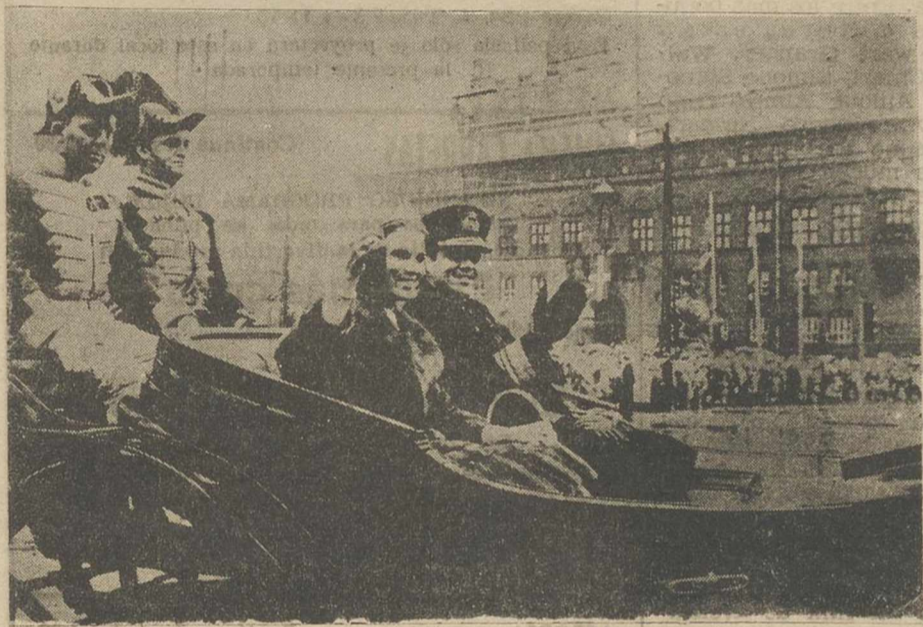
Ofrecemos una de las últimas fotografías de solteros del rey Constantino de Grecia y la princesa Ana María de Dinamarca, tomada en las calles de Copenhague, cuando la feliz pareja se disponía a marchar a Atenas, donde esta mañana han contraído matrimonio. (FOTO FIEL).

A la fastuosa ceremonia asistieron representantes de todos los países del mundo y el pueblo de Atenas aclamó delirantemente al nuevo matrimonio