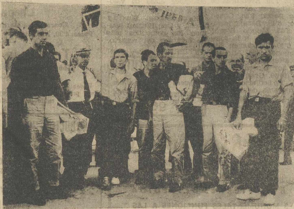
Un grupo de los 13 supervivientes del carguero español «Sierra de Aránzazu», atacado e incendiado cerca de Cuba, por embarcaciones anticomunistas, en el aeropuerto de Barajas, a donde llegaron en avión, procedentes de Puerto Rico.