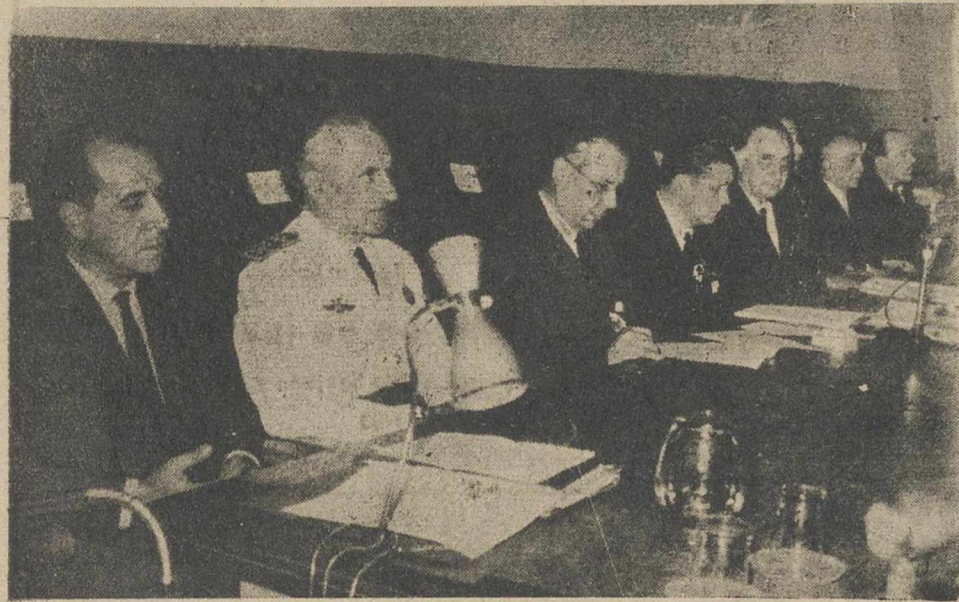
Presidencia de la solemne sesión de clausura del VI Pleno del Consejo Económico-Sindical de Albacete, celebrada ayer en la Casa Sindical.

Así lo anunció ayer el vicesecretario nacional de Ordenación Económica, señor Argamentería, en su discurso de clausura del VI Pleno del Consejo Económico-Sindical