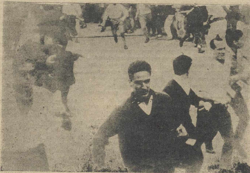
El príncipe Carlos Hugo de Borbón Parma ha corrido en los «sanfermines» por las calles de Pamplona. En la foto le vemos, a la derecha, ante los toros de la ganadería de Bohórquez.