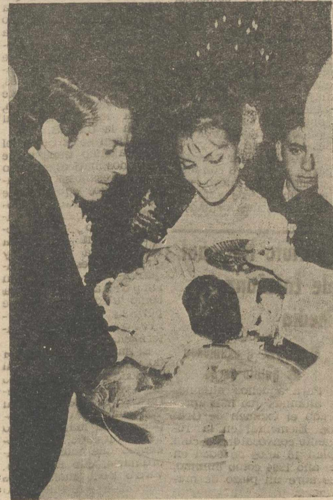
En la fotografía vemos a Carmen Sevilla—hoy feliz mamá por vez primera—actuando, en unión del popular bailarín Antonio, como padrinos del primer hijo de Lola Flores, otra famosa artista del mismo género de Carmen. Esta vez, los padrinos del bautizo serán "Marisol" y "El Cordobés".