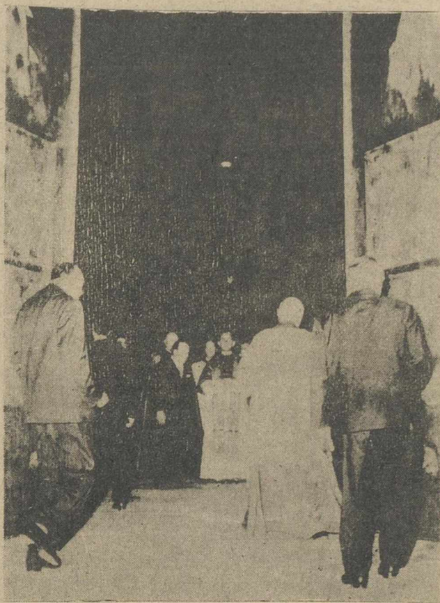
Su Santidad Pablo VI, acompañado del escultor Manzu, después de descorrer las cortinas que cubrían la nueva puerta—obra del escultor—inaugurada en la Basilica de San Pedro.