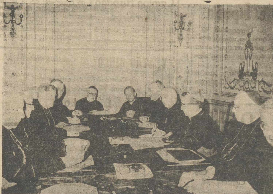
Bajo la presidencia del cardenal primado, doctor Pla y Deniel (al fondo) ha comenzado la conferencia de metropolitanos españoles. Asistió también el nuncio apostólico monseñor Riberi.—(FOTO FIEL).