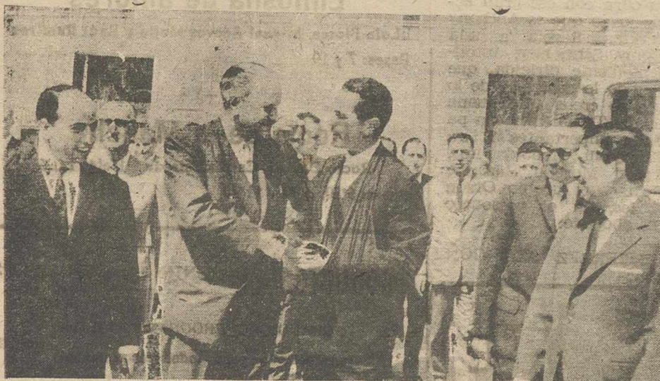
Después de la estancia en Madrid del ministro marroquí de Asuntos Exteriores, señor Guérída, ha salido para Rabat su colega español, señor Castiella, al frente de una importante delegación. En la foto, le vemos en el aeropuerto de Barajas, minutos antes de emprender el vuelo.