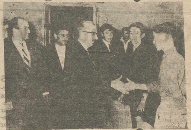
Del Taller Escuela Sindical "Nuestra Señora de los Llanos", ha salido ya la primera promoción de oficiales industriales, que integran 27 alumnos, que el pasado miércoles cumplieron al Excmo. señor gobernador civil en su despacho oficial y de cuyo acto dimos aquel día la oportuna información, que hoy completamos con este testimonio gráfico.