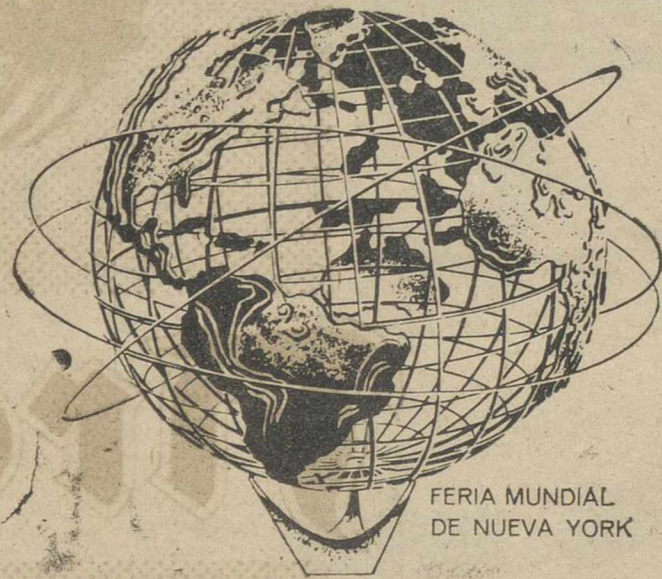
FERIA MUNDIAL DE NUEVA YORK

300 plazas a ingreso en el Cuerpo General de Policía. Instancias hasta el día 13 de junio. Preparación teórica y práctica José María Lozano. Calle Saturnino López, 1 Albacete.