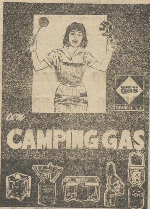
Para que usted cocine según sus necesidades CAMPING GAS le ofrece recipientes de cocinas, todos con la BOTELLA AZUL... ESTUFA Y LAMPARAS CAMPING GAS... BOTELLA AZUL que se incorpora a los aparatos más prácticos que usted pudo tener.