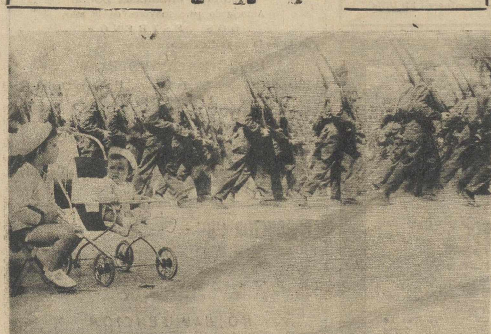
Los 13.000 hombres y 1.000 vehículos militares que participarán el próximo domingo en Madrid en el vigésimoquinto desfile de la Victoria ante el Jefe del Estado, se preparan intensamente estos días. En la foto, una unidad del Ejército del Aire desfila en la Avenida del Generalísimo ante un improvisado público de niños que, con sus madres, toma el sol.