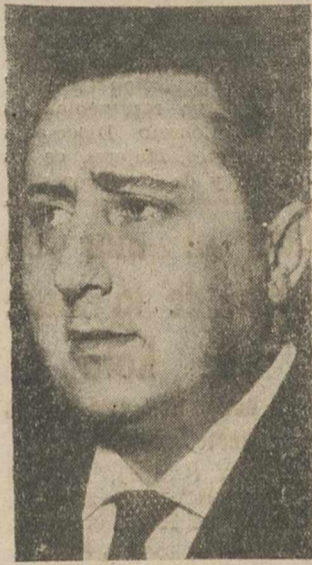
Los periodistas albacetenses estamos francamente impresionados. No recordamos

precedente de que una alta personalidad política se haya mostrado más abiertamente simpática, comunicativa y deseosa de conocer a fondo los problemas provinciales. Don Pio Cabanillas y Gallas, subsecretario de Información y Turismo, talento y sencillez, nos reunió, aprovechando ratos libres de su apretado programa, en dos ocasiones. Y todavía se marchó con deseos de prolongar en otra oportunidad el cambio de impresiones. "LA LEY DE PRENSA DE CAUSA A EXCLUSIVAMENTE SOBRE LOS DIRECTORES"