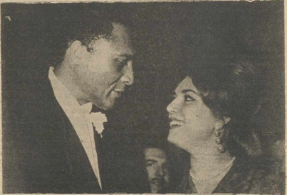
El actor americano William Marshal—casi dos metros de estatura—ha intervenido con la rubia Ángela Bravo en la película «Piedra de toque», cuya acción transcurre en la Guinea.—(Fotos: López CONTRERAS).

Hay quien cree que un vehículo conducido por una mujer es más peligroso que otro cuyo conductor es varón. La historieta, el chiste, el chascarrillo, propaga esta opinión, hasta hacerla parecer cierta.