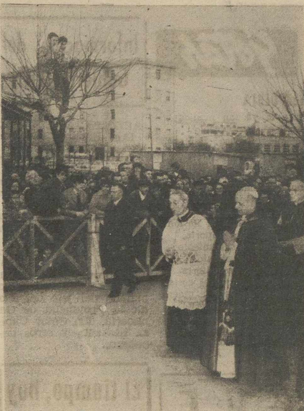
En el segundo domingo de Cuaresma, S. S. el Papa Paulo VI, ha visitado la Parroquia de Nuestra Señora de Lourdes, en el populoso barrio romano de Tormarancio. En la fotografía vemos al Papa durante un momento de su visita.