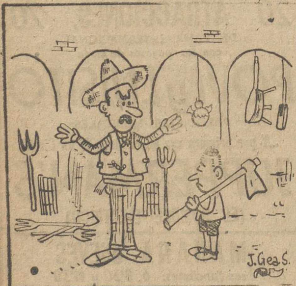
—No te entiendo hijo! Dices que te ferie algo, y te ferio la azada. ¿A qué viene esa cara ahora?