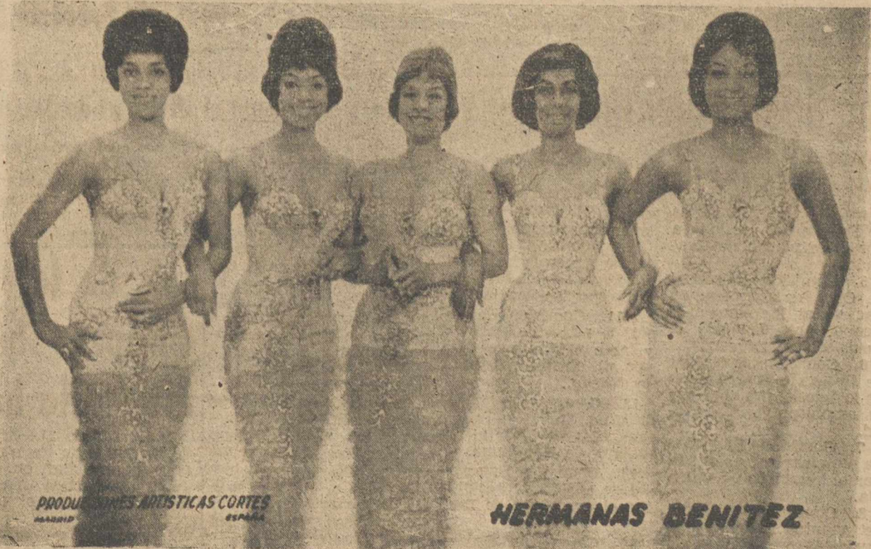
PRODUCCIONES ARTISTICAS CORTES