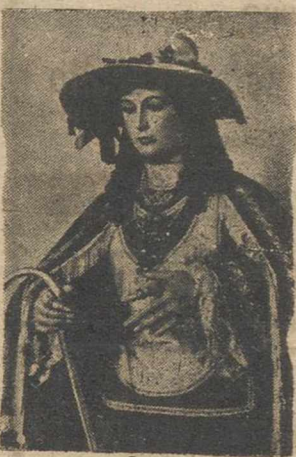
Nuestra Señora de Guadaluca, patrona de Guadalcanal.