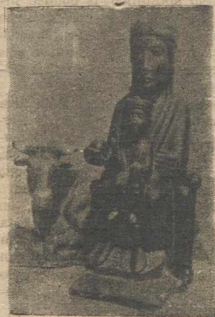
Nuestra Señora del Turo, Patrona de Olot.

—Todas las imágenes tienen facetas sumamente interesantes. Todavía no he hallado ninguna igual a otra, pero, dentro de esta variedad, ofrece gran atractivo la de Nuestra Señora de la Buena Leche, pequeña litografía que reproduce a la Patrona de Esquivias (Toledo), que aparece dan-