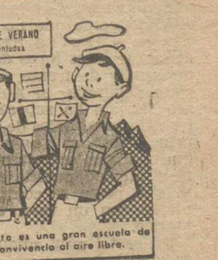
El Campamento es una gran escuela de hermandad y convivencia al aire libre.