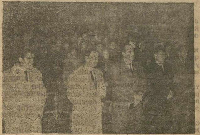
Con motivo de la festividad de San Juan Bosco, la Escuela de Formación Profesional de la Delegación Provincial de Sindicatos, celebró ayer diversos actos en honor de su Patrón, iniciados con la Santa Misa, que ofició el Excmo. y Rvdmo. señor obispo de la Diócesis y que fue presidida por el delegado de la Organización Sindical y otras jerarquías, que aparecen en la fotografía de Sáiz.