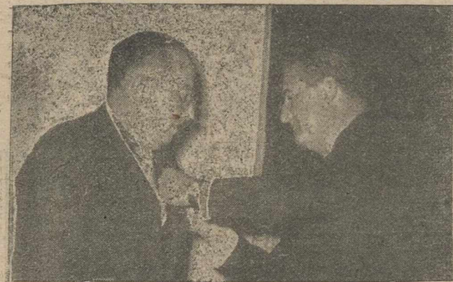
El gobernador civil imponiendo al delegado provincial de Asociaciones y secretario de las Academias Profesionales, las insignias del «Victor de Plata» del S.E.U.