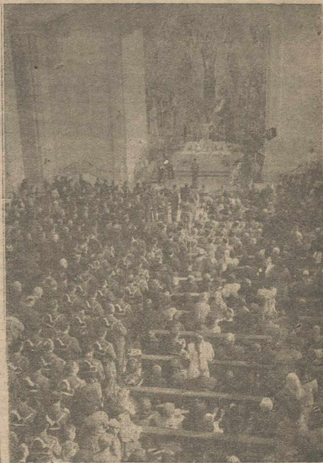
Completando nuestra amplia información gráfica y literaria publicada ayer, sobre los actos organizados por la Comandancia de la Guardia Civil, en honor de su Patrona, la Santísima Virgen del Pilar, con esta fotografía que refleja un momento de la Misa solemne celebrada en la Parroquia del Pilar, cuyas amplias naves estaban totalmente ocupadas por los fieles.

En la mañana de hoy el presidente recibirá a los representantes de los 15 nuevos países independientes africanos, recientemente admitidos en la O.N.U. Por la tarde, acompañado de su esposa, se trasladará a su granja de Gettysburg, en Pensilvania, donde celebrarán el cumpleaños con su hijo, esposa y cuatro nietos.—Efe.