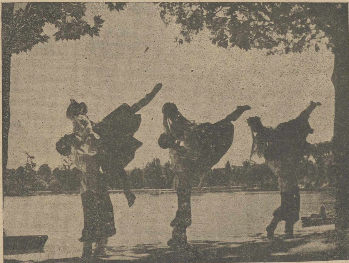
Entre las atracciones internacionales que vienen actuando en la Caseta Municipal de los Jardinitillos de la Feria, y de las que nos ocupamos en números sucesivos, destacamos hoy el "Ballet Kosaco", de Dimitry Konstantinoff, que trae al encantador recinto el ritmo y la gracia de las danzas del Volga, poniendo una nota de exotismo y belleza plástica en las tardes de la Feria.