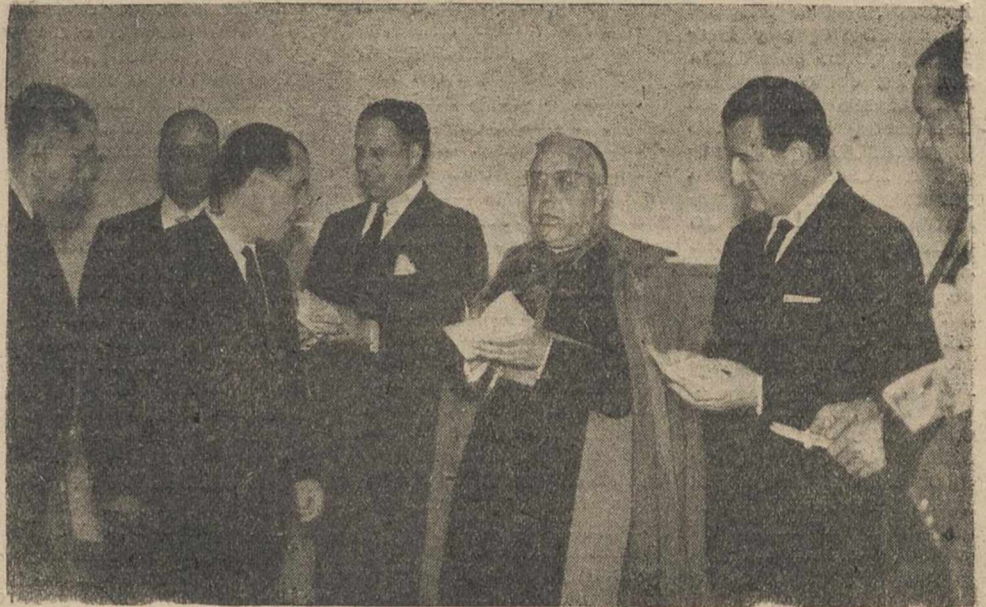
Las autoridades que asistieron a los brillantes actos de ayer, preparadas para la entrega de libretas de ahorro a los matrimonios contraidos en el pasado mes de abril.

DISCURSO DEL GOBERNADOR CIVIL Cerró el acto con un breve y elocuente discurso, el gobernador civil y jefe provincial del Movimiento, quien comenzó diciendo que hoy era día