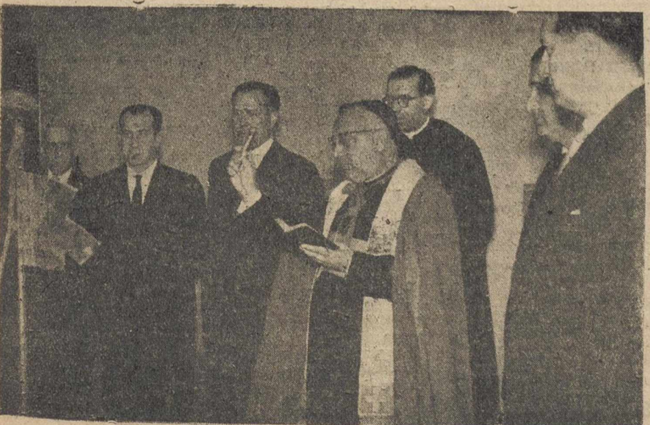
El obispo de la Diócesis, doctor Tabera Araoz, durante el acto de la bendición de las instalaciones de la Caja de Ahorros Provincial.

De dicho acto daremos detallada información en nuestro número de mañana.