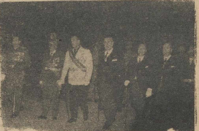
El gobernador civil y jefe provincial del Movimiento, con las demás primeras autoridades, en la presidencia oficial de la procesión de anoche.