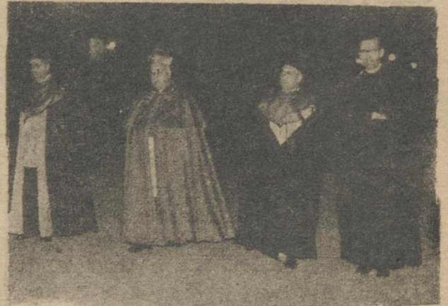
El obispo de la Diócesis, en la presidencia religiosa de la solemne procesión del Santo Entierro, celebrada anoche en nuestra capital.