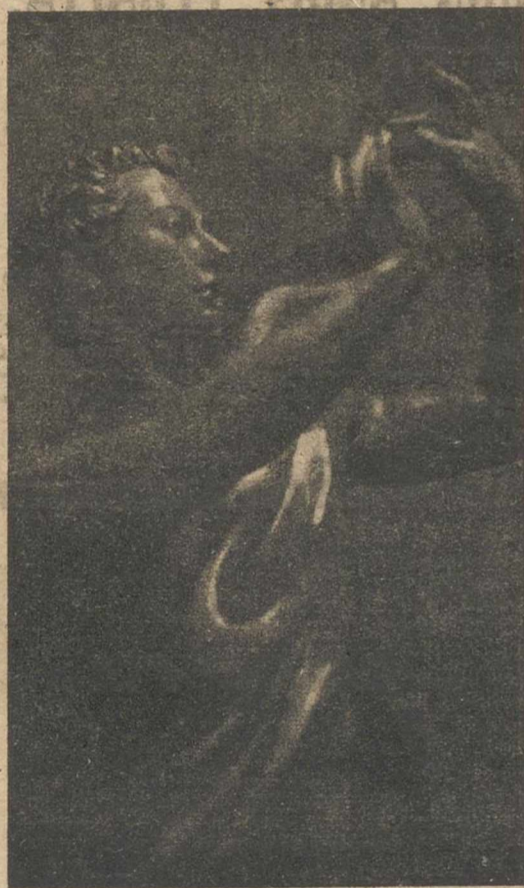
En estas fechas que celebramos la Semana Santa,