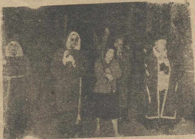
Penitentes y cofrades en la impresionante procesión del Silencio, celebrada en la medianoche del Jueves Santo y que revistió extraordinario fervor.