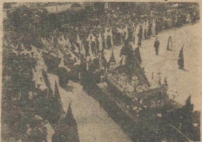
Un aspecto de la Plaza del Caudillo, durante la procesión del Encuentro, celebrada ayer, recogiendo el momento en que Nuestro Padre Jesús Nazareno, se acerca a la Verónica. (Fotos SAIZ).