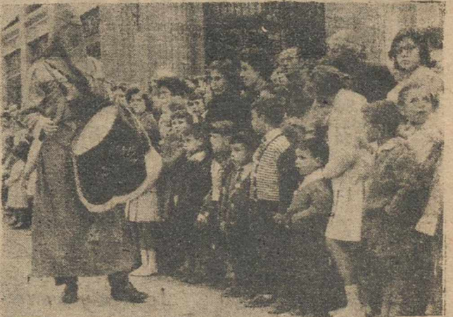
Todas las procesiones han sido presenciadas por grandes masas de público y esta nota gráfica está recogida durante la procesión del Encuentro, celebrada en la mañana de ayer, Viernes Santo.