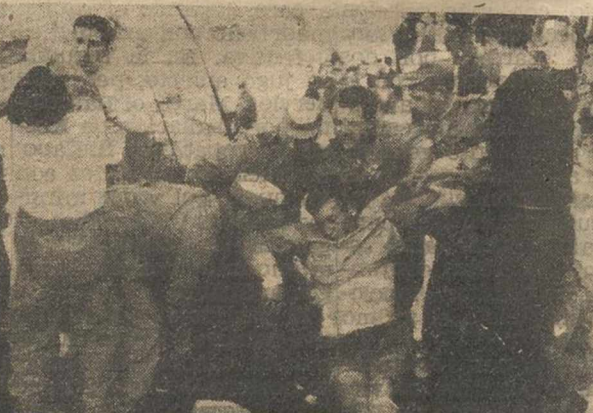
El momento en que se recoge el balón en la Condomina.