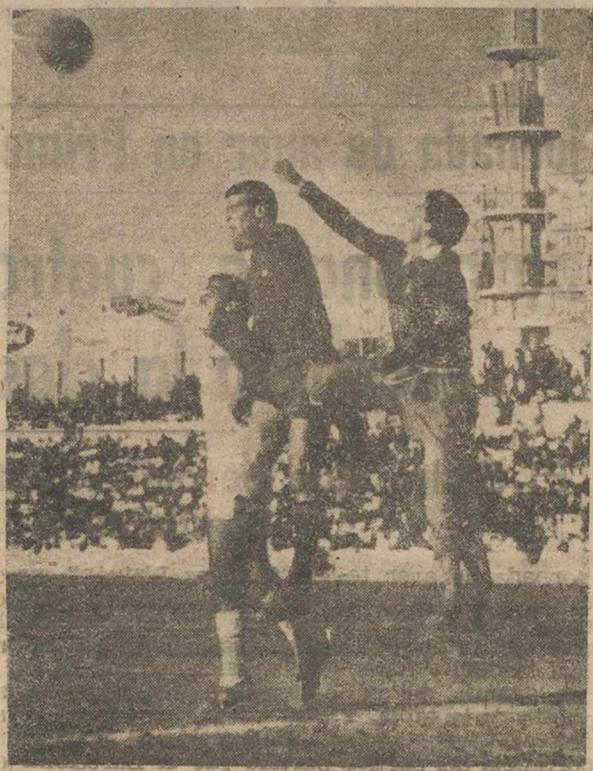
Señalando al balón, los jugadores de Albacete en la Condomina.