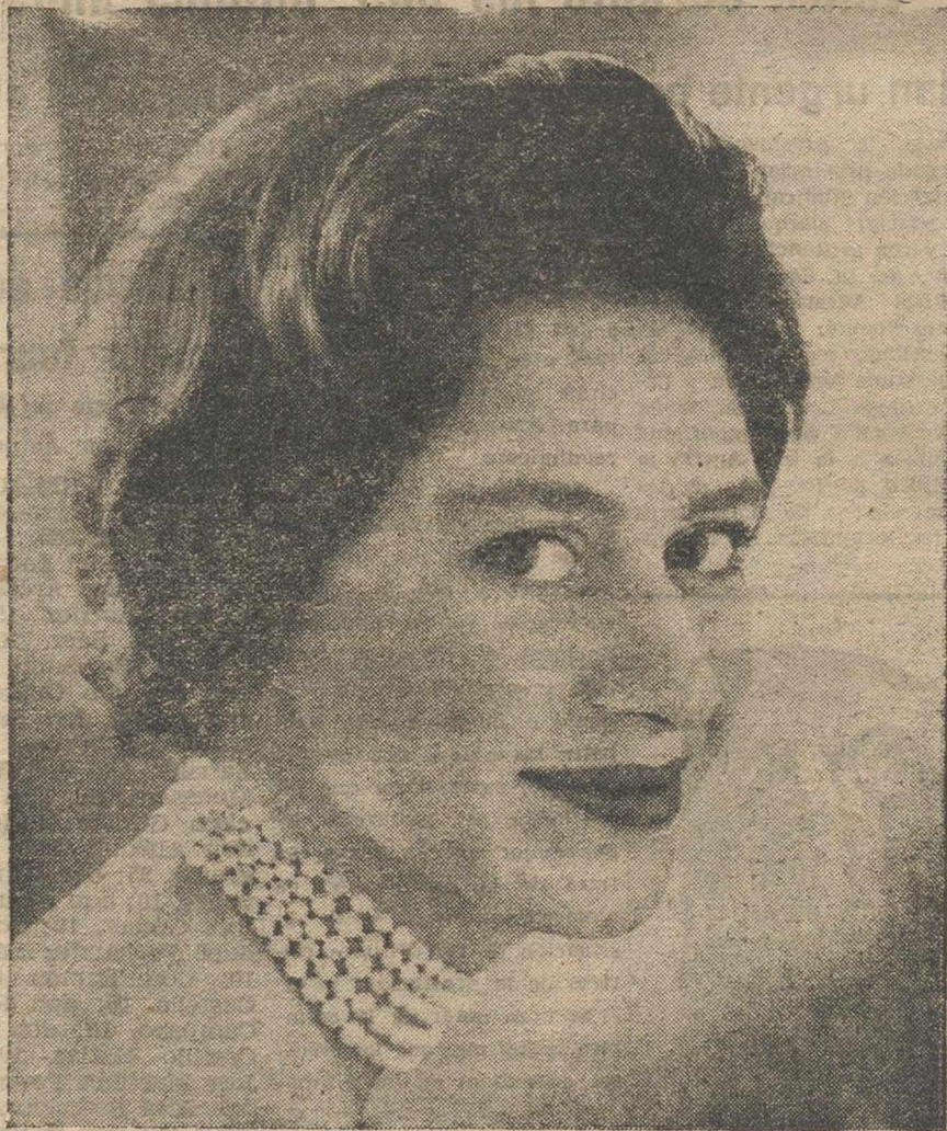
Esta fotografía de Su Alteza Real la princesa Margarita de Gran Bretaña fue tomada por Antony Armstrong Jones en el Royal Lodge de Windsor. La princesa, que cumple 30 años el 21 de agosto próximo, lleva un collar de perlas de cinco hileras.