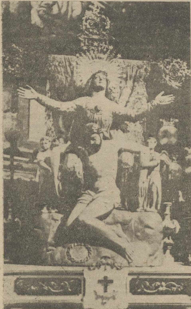
La Hermandad y Mayordomos de la Virgen de la Cruz, organiza en Lezuza las tradicionales fiestas que en honor de su Excelsa Patrona, se celebrarán en aquella localidad, del 1 al 10 de mayo. Mañana, jueves, día 1, se

Se celebrarán del 1 al 10 de mayo en honor de la Virgen de la Cruz