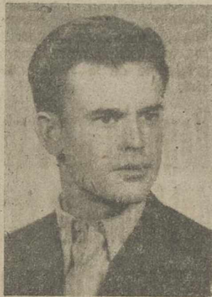
Y este es el breve resumen de partidos, goles y jugadores que brindamos a los que gustan hacer números sobre lo pasado.