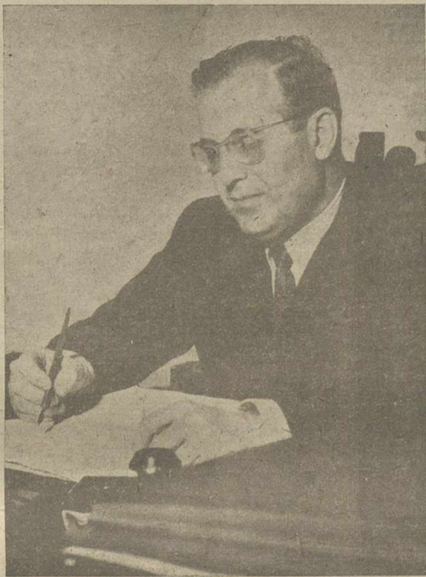
altura", como se dice en lenguaje marinerío; meditar sobre lo hecho y

Ante todo, hay que señalar las dificultades económicas en que se desenvuelven la tarea agrícola y la necesidad evidente de defender una situación de equilibrio en lo económico y en lo social. Para conseguir esto no son suficientes las soluciones esporádicas o de urgencia, llamadas, con acierto por José Antonio "parches técnicos", que de momento permiten salir del paso ante un problema circunstancial, pero que no afrontan las causas del mal en su raíz, trazando remedios profundos y eficaces. Hacen falta fórmulas definitivas, y es preciso crear las condiciones adecuadas que restituyan la contitura defectuosa de la actual economía campesina. Convendría en el momento actual "tomar