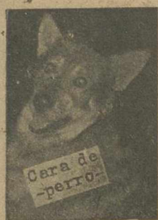
Cara de perro.