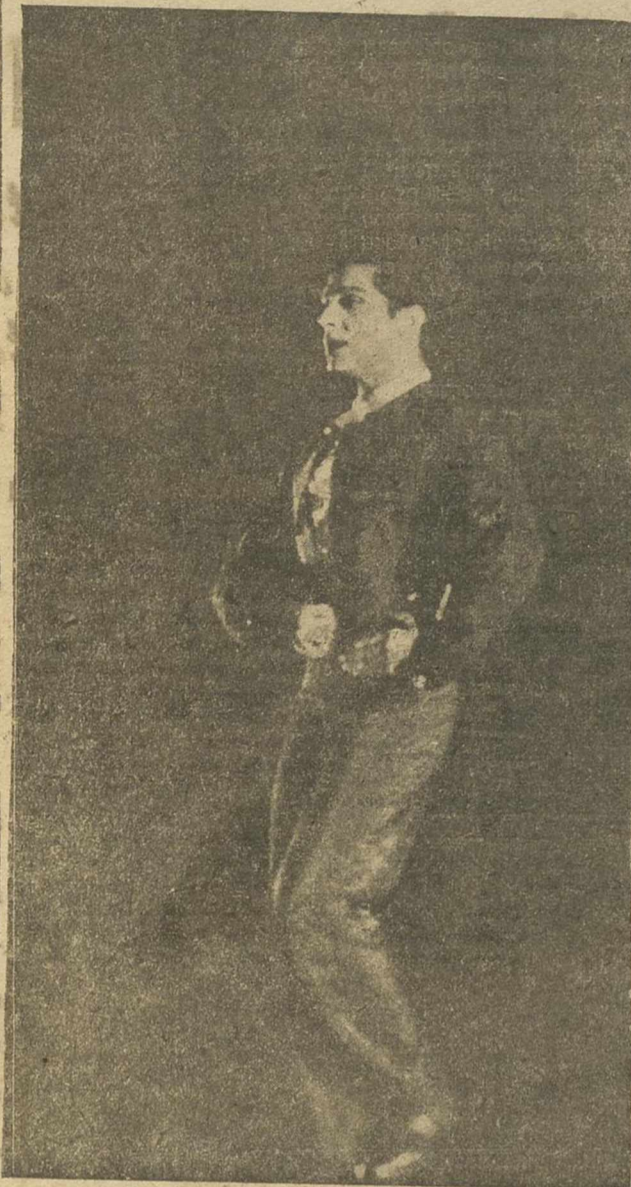
EL FAMOSO BAILARIN, ANTONIO, CUYA AGTUACION EN ALBACETE EN LA PASADA FERIA CONSTITUYO UN AUTENTICO ACONTECIMIENTO

La personalidad de Iturbi, así como las versiones que nos dió de las obras programadas, avaloran los elogios que publicamos en nuestra crítica del día 19 de noviembre, y los aplausos que el público