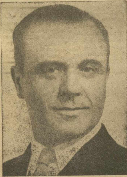
EL GRAN DIRECTOR DE FAMA MUNDIAL, DON JOSE ITURBI, QUE EN 1957 VOLVIO A ACTUAR Y TRIUNFO ANTE EL PUBLICO DE ALBACETE