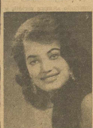
La «estrella» de 1958

Mañana, día 1 de enero, a las doce horas, tendrá lugar en el Palacio Provincial, la inauguración de la Exposición de Pintura en la que la Excelentísima Diputación presentará la obra de sus becarios.