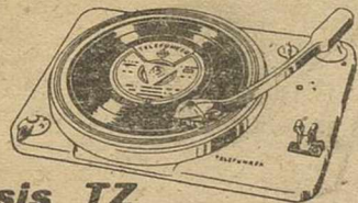
Chasis TZ 1.290 Pts.