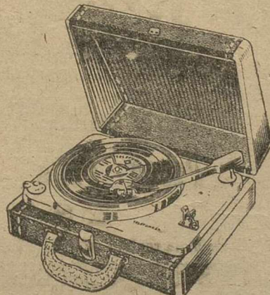
Allegro TZC 1.650 Pts.