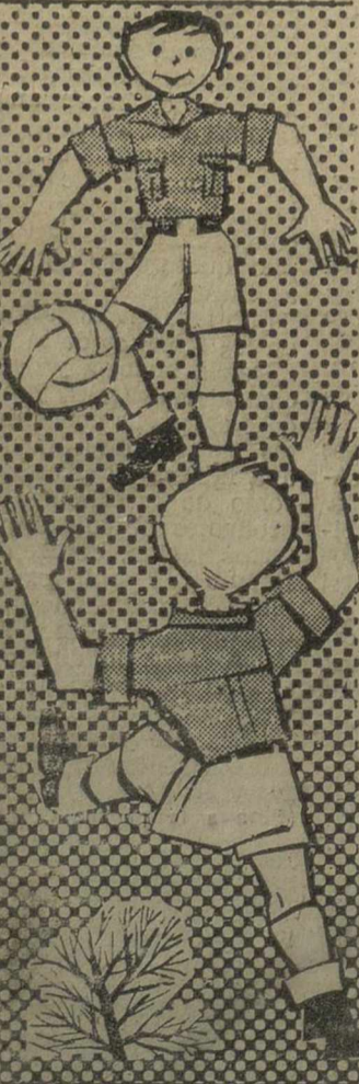
CAMPAMENTOS DE VERANO Frente de Juventudes

Ejemplo, deporte, salud y alegría; todo se hace luminosa realidad viviendo los veinte días de un Campamento.