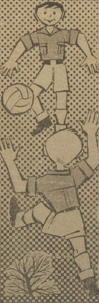
CAMPAMENTOS DE VERANO Frente de Juventudes

Ejemplo, deporte, salud y alegría; todo se hace luminoso realidad viviendo los veinte días de un Campamento.