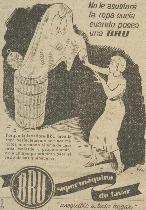
Porque la lavadora BRU lava la ropa perfectamente en unos minutos, ahorrando al ama de casa toda molestia y proporcionándole un tiempo precioso para el resto de sus quehaceres.