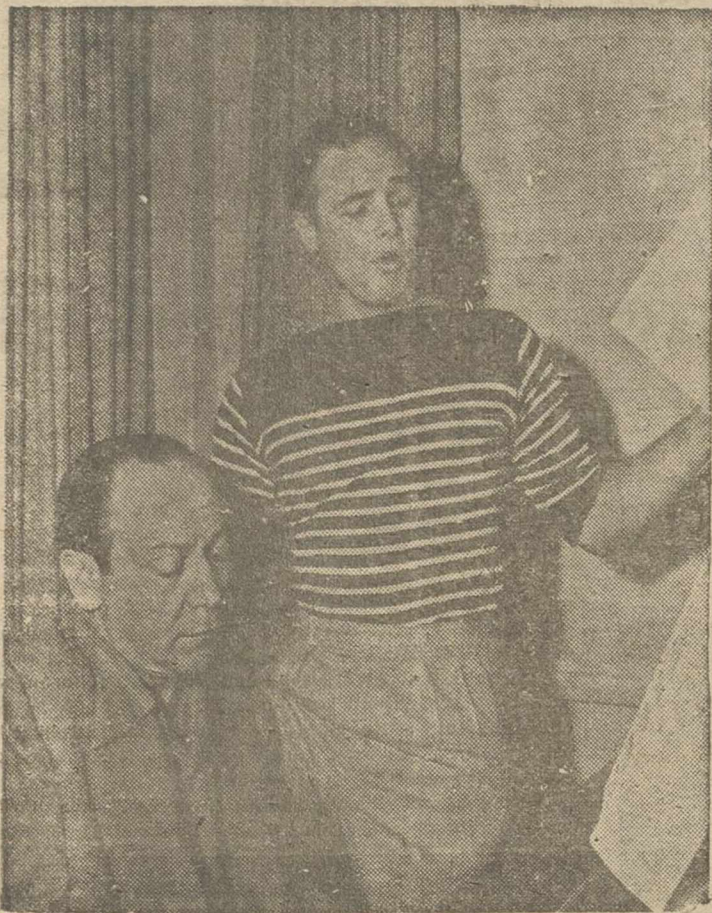
Por primera vez, Marlon Brando canta en un film. Este sensacional acontecimiento tiene lugar en la nueva película de Samuel Goldwyn, distribuida por M G M, «ELLOS Y ELLAS» («Guys and dolls»). Aquí vemos al genial actor ensayando una canción con el compositor Frank Loesser al piano. Otras estrellas, en «ELLOS Y ELLAS», son Frank Sinatra, Jean Simmons y Vivian Blaine.