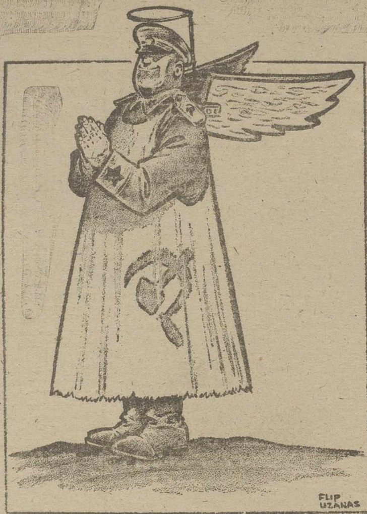
Dibujo de Philip Uzanas publicado en el Hartford Courant, de Hartford, Connecticut (U.S.A.)