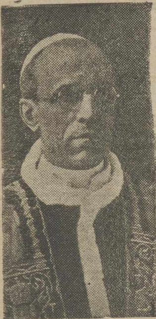
Comenzó la memorable jornada con la solemne Misa de Comunión general que Su Excelencia Reverendísima el Prelado de la Diócesis, ofició a las nueve de la mañana en la Santa Iglesia Catedral, cuyas amplias naves resultaban insuficientes para contener a los fieles que quisieron rendir con su asistencia el homenaje de su respeto y sumisión a Su Santidad.

La jornada de ayer, que tuvo el emotivo prelude del homenaje rendido a Su Santidad, en la tarde del sábado, por las Mujeres de Acción Católica y del que demás cuenta al final de esta información, resultó verdaderamente brillante y solemne, no sólo por la esplendidez de los actos organizados, sino por el calor que les prestó el pueblo albacetense, concurriendo a los mismos y exteriorizando sus sentimientos de adhesión y fervor hacia la venerable figura de Pío XII, nuestro Pontífice providencial.